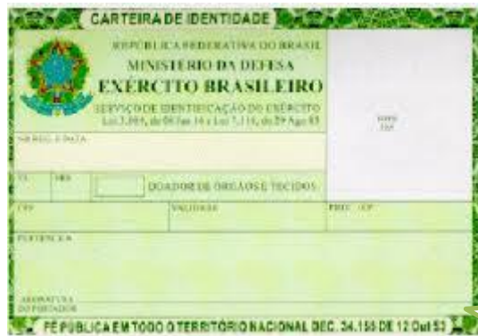
Documentação do falecido.