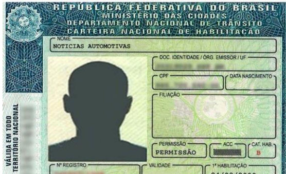
Documentação do requerente.