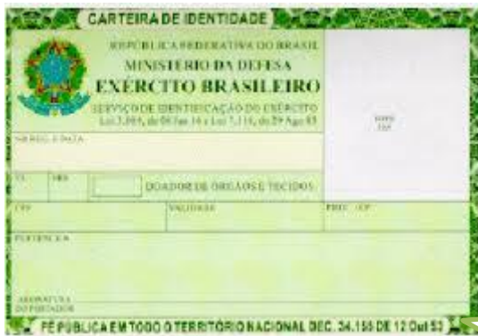
Documentação do falecido.