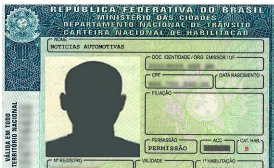
Documentação do requerente.