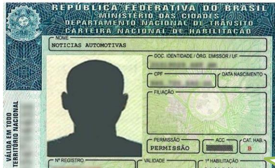
Documentação do falecido.