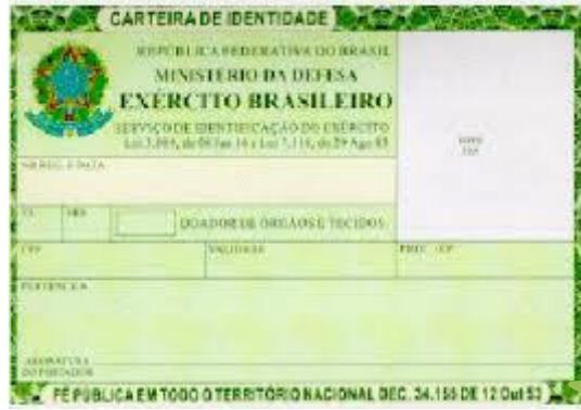
Documentação do requerente.